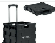
Skrzynka bagażowa Gadżety