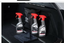
Zestaw kosmetyków samochodowych Toyota Kosmetyki